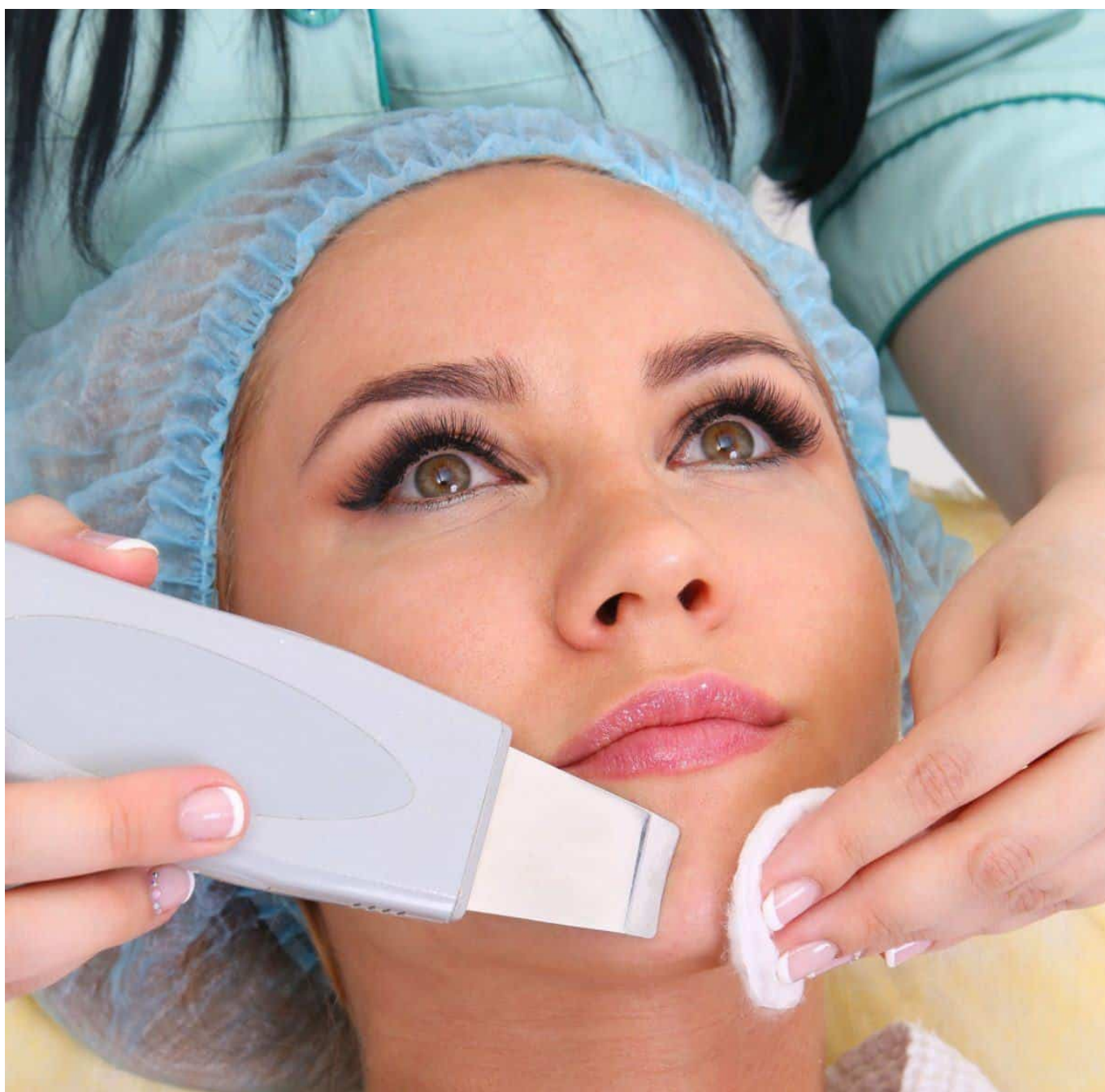
Curso De Tratamentos Faciais