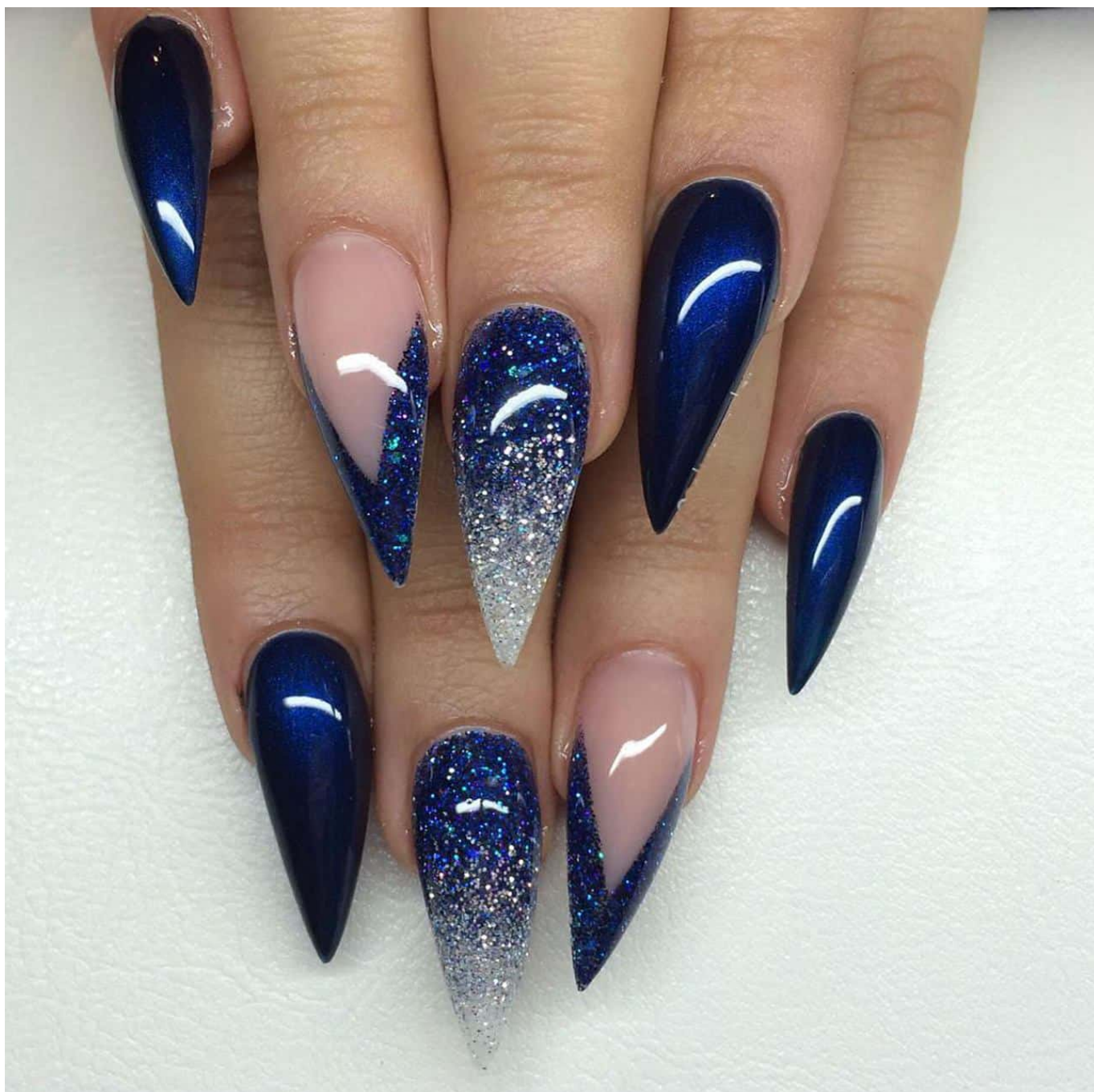
Curso Design De Unhas